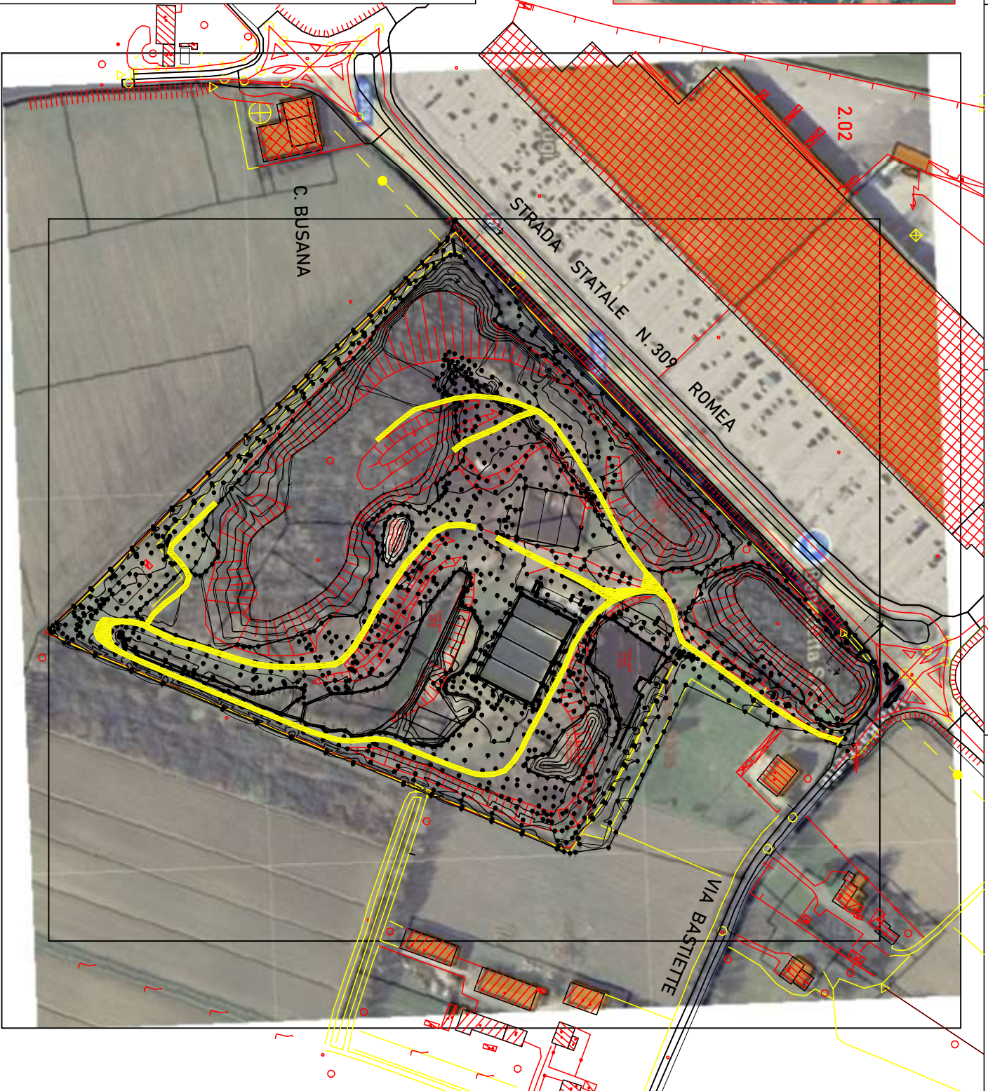
PLANIMETRIA INDIVIDUAZIONE VIABILITA' STERRATA INTERNA